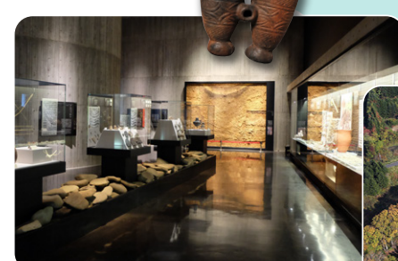
函馆绳文文化交流中心